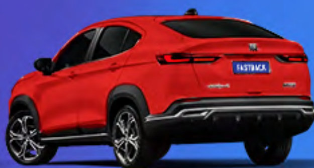
Rojo Monte Carlo + techo negro