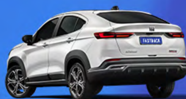
Blanco Banchista + techo negro