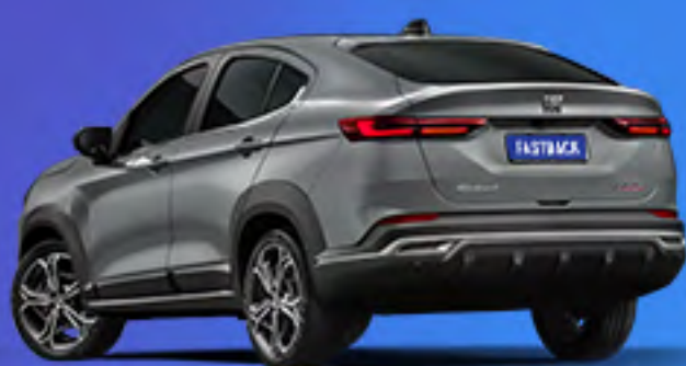
Cinza Strato + techo negro