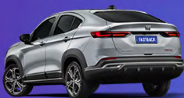
Plata Bari + techo negro