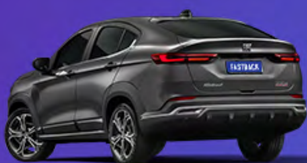
Cinza Silverston + techo negro