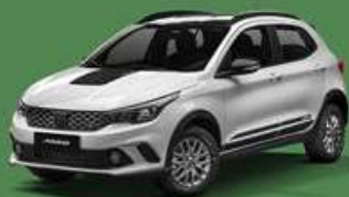
Blanco Alaska + Techo negro vulcano