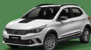
Blanco Banchisa + Techo negro vulcano