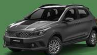
Cinza Silverstone + Techo negro vulcano