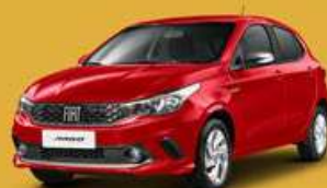
Vermelho Monte Carlo