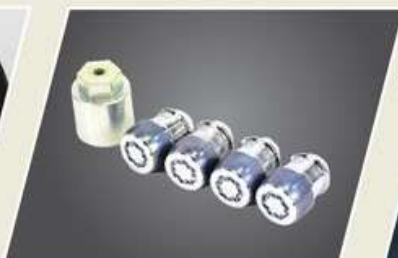
BIRLOS DE SEGURIDAD