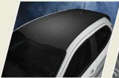
VINIL DE TECHO NEGRO

Haz tu FIAT ARGO más imponente, funcional y seguro; pero sobre todo personalízalo con accesorios Mopar®.