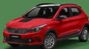
Vermelho Monte Carlo + Techo negro vulcano