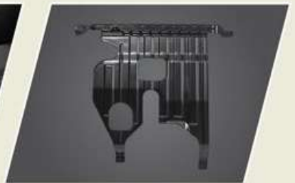
PROTECTOR DE CARTER