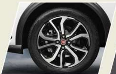
RIN DE 16"