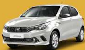
Blanco Alaska (Perlado)