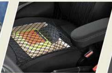
RED ORGANIZADORA PARA ASIENTO