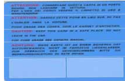
Imagen muestra de la tarjeta

Esta tarjeta contiene los códigos de seguridad de su vehículo.